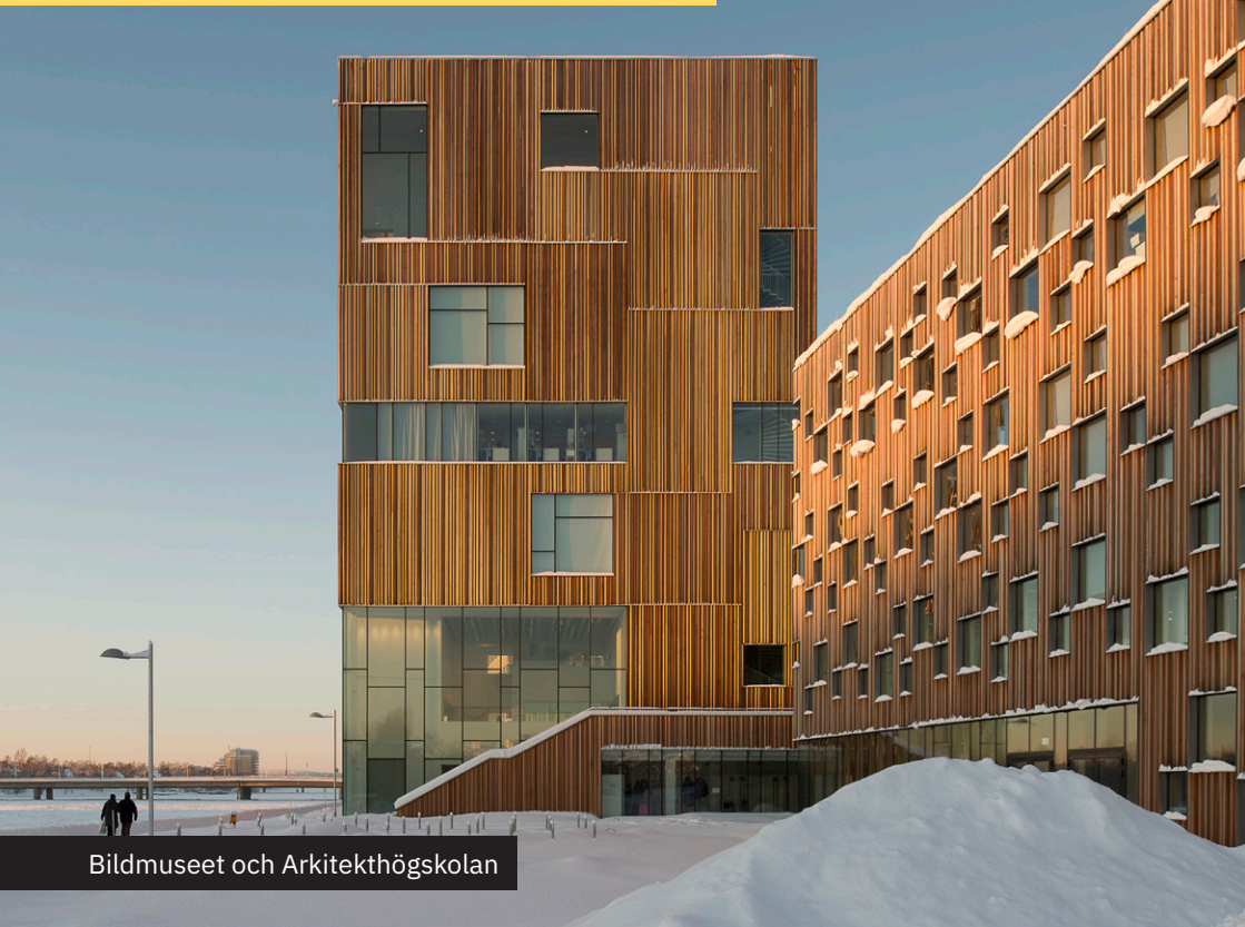
Bildmuseet och Arkitektshögskolan