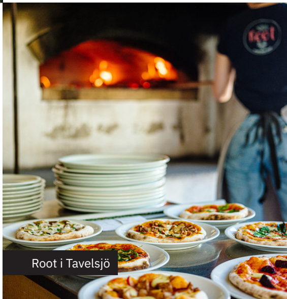
Root i Tavelsjö

För dig som gärna kombinerar måltiden med en aktivitet kan vi tipsa om O'Learys, som bland annat erbjuder bowling och minigolf (inomhus), eller Orangeriet, med boule och shuffleboard. Apprestaurangen Pinchos har cirkustema och brukar vara en riktig barnfavorit. Gör en utflykt till Tavelsjö och du hittar restaurang Root som erbjuder både pizza och aktiviteter.